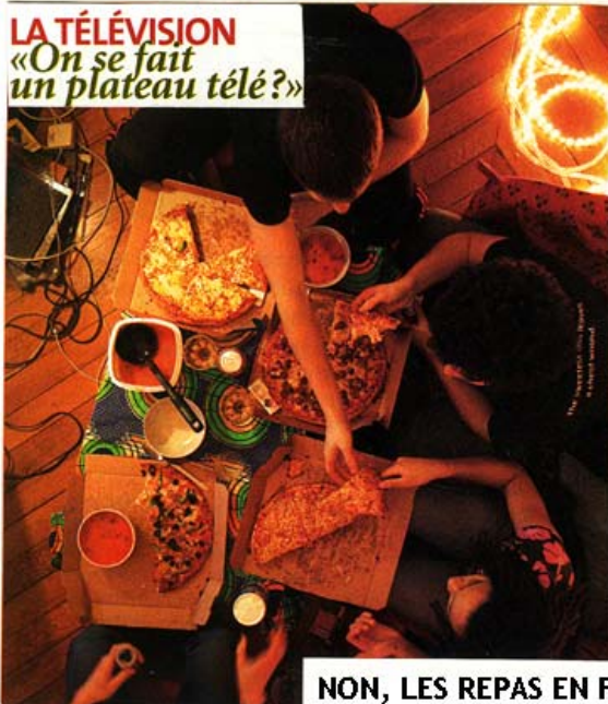
LA TÉLÉVISION «On se fait un plateau télé?»