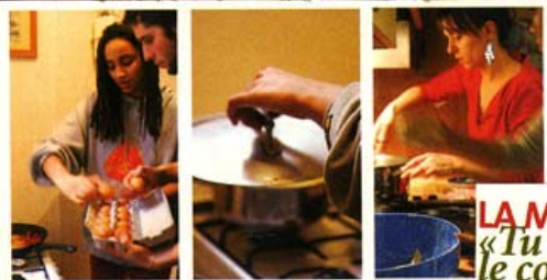
LA MAIN À LA PÂTE «Tu peux éplucher le concombre?»