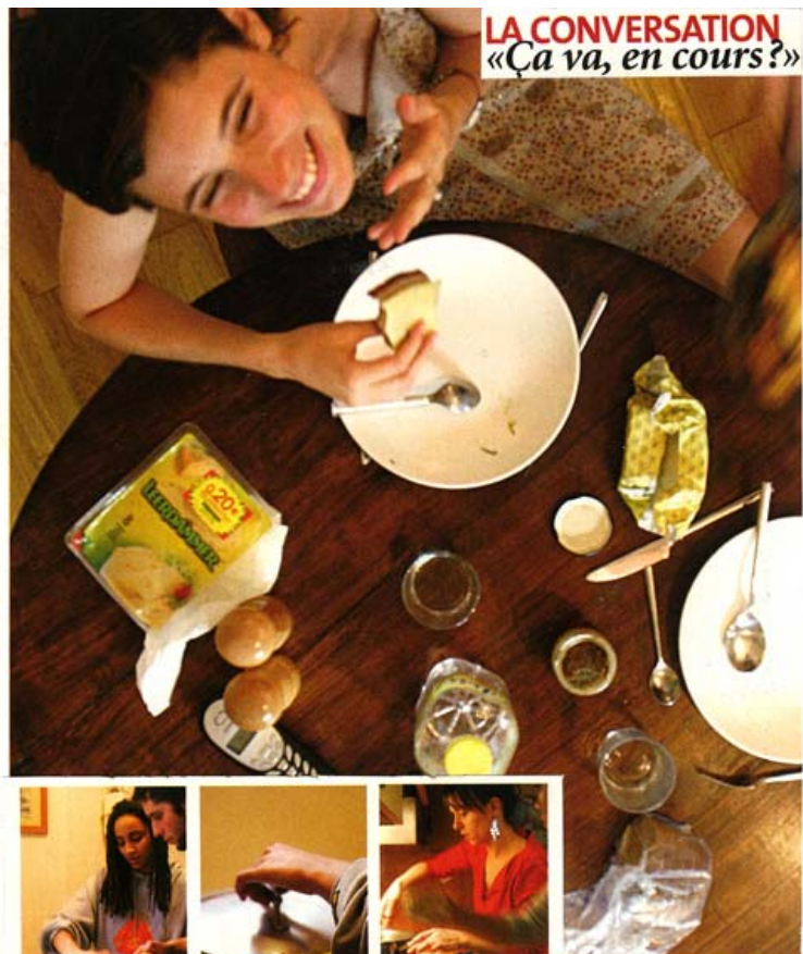
LA CONVERSATION «Ca va, en cours?»