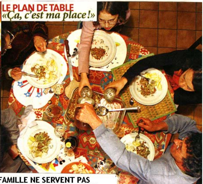
LE PLAN DE TABLE «Ça, c'est ma place!»