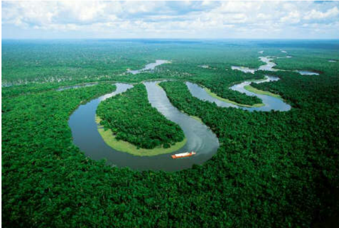
Kid's Fun, Σεπτέμβριος 2007

Ειδικοί από την Βραζιλία ανακάλυψαν ένα νέο σημείο από το οποίο ξεκινάει ο Αμαζόνιος, το οποίο μπορεί να αλλάξει κατά πολύ τα δεδομένα. Συγκεκριμένα, Βραζιλιάνοι ειδικοί μετά από ταξίδι δύο εβδομάδων σε συνθήκες παγετού και υψόμετρο 5.000 μέτρων, υποστηρίζουν ότι ανακάλυψαν στο νότιο Περού, την πηγή του Αμαζονίου. Εάν αυτή η ανακάλυψη ισχύει θα φτάσει τα 6.800 χιλιόμετρα, καθιστώντας τον, το μεγαλύτερο σε μήκος ποτάμι του κόσμου. Ο Νείλος έχει μήκος 6.695 χιλιόμετρα.